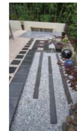
和の雰囲気とモダンなデザイン。▼