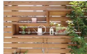
▲オリジナル飾り棚。何を飾るか、どんな風に飾るか。飾り手のイマジネーションをかき立てる形に仕上げました。