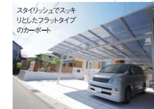
スタイリッシュでスっきりとしたフラットタイプのカーポート