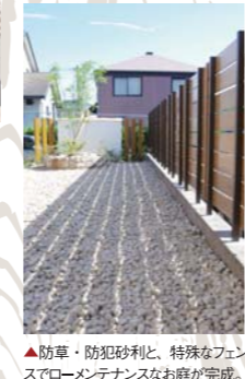
▲防草・防犯砂利と、特殊なフェンスでローメンテナンスなお庭が完成。