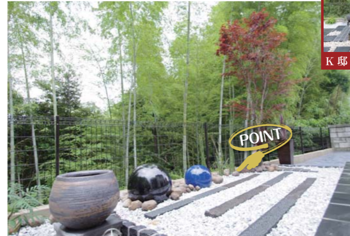
タイルと2色の球体オブジェはモダンな雰囲気演出。