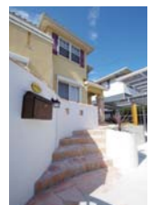
◀ゲストも楽しめる曲線的デザインのプロバンス門まわり。