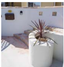
螺旋状の花壇には、インパクトある植栽で装飾。