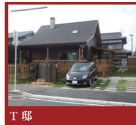
▲毎日、枕木の上だけを「ねらって」歩くのが楽しい！